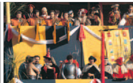
Le Palio dei Dieci Comuni, à Montagnana