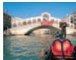
Le pont du Rialto, sur le Grand Canal