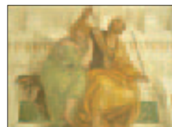
La Passion et la Vertu, de Veronese, villa Barbaro à Maser