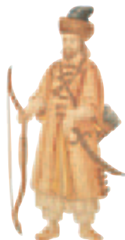
Le voyageur vénitien Marco Polo