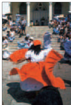
Spectacle de danse traditionnelle près de Cartago