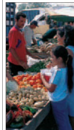
Fruits et légumes au marché de Santa Cruz, Guanacaste

ACTIVITÉS DE PLEIN AIR ET SÉJOURS À THÈME 248