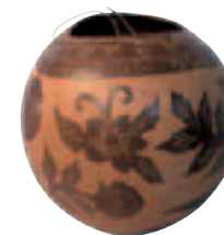
Gourde traditionnelle bribri peinte et sculptée