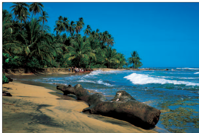
Playa Chiquita sur la côte caraïbe

Dépôt légal : janvier 2011 ISBN : 978-2-01-244990-9 ISSN : 1246-8134 Collection 32 - Édition 01 N° DE CODIFICATION : 24-4990-8