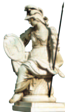
Athéna Pallas, ancien hôtel de ville