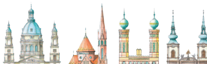
Dômes, tours et flèches de quatre des plus remarquables lieux de culte de Budapest