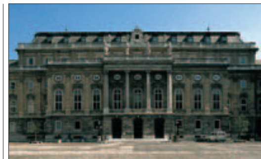
La Galerie nationale hongroise (p. 74-77) dans l'ancien Palais royal