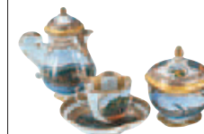
Service en porcelaine du musée des Arts décoratifs (p. 136-137)