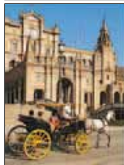
Attelage sur la Plaza de España, Parque María Luisa

HISTOIRE DE SÉVILLE ET DE L'ANDALOUSIE 40