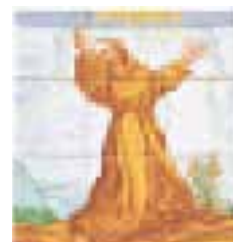
Plaque de rue en céramique, Estepona