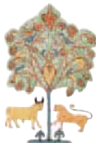
Enluminure tirée d'une bible mozarabe du x e siècle

PRÉSENTATION DE SÉVILLE ET DE L'ANDALOUSIE